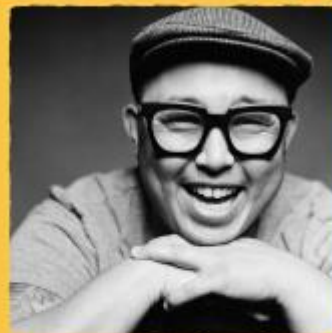
Kuem — Somatische Begleitung

Begrenzte Plätze! Bis zum 03.05.25 werden Plätze für BIPoC, trans* Menschen und Leuten Ü55 reserviert. Schreibt dazu, wenn das auf euch zutrifft.