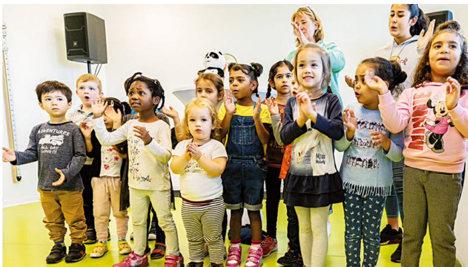
Kinder aus der AWO-Kita Pustebume brachten den Gästen bei der Eröffnung ein Ständchen.

„Vor zwei Jahren haben wir die Vereinbarung über die Zusammenarbeit geschlossen. Nun wird