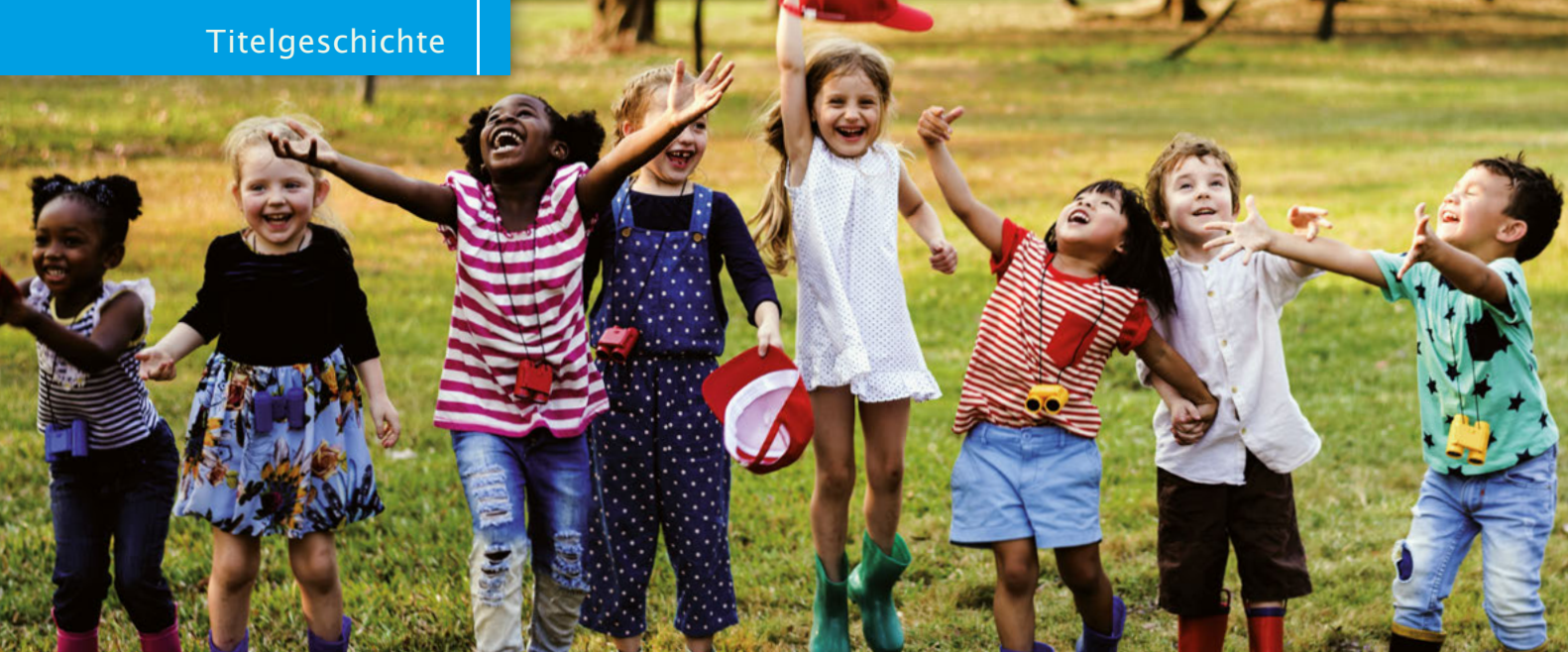
Die neue AWO-Kita Pandabär steht chinesischen und Kindern anderer Nationen gleichermaßen offen.